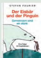
Der Eisbär und der Pinguin Gemeinsam sind wir stark. Stefan Fourier 2007, Pendo